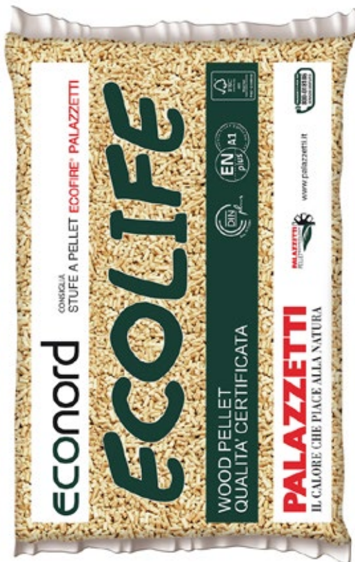
Sacchetto da Kg 15