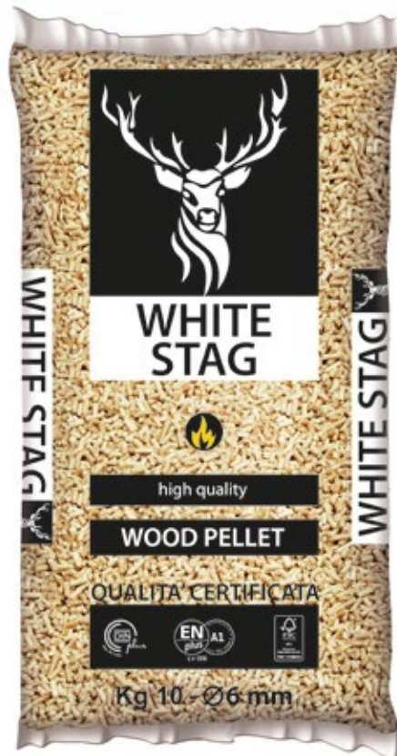
Sacchetto da Kg 10